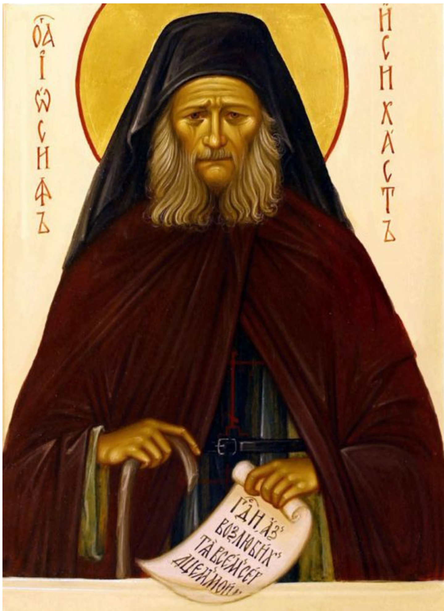
Фото: Храм Рождества Христова, Вялицы. Схиархимандрит Софроний (1896—1993). В миру —