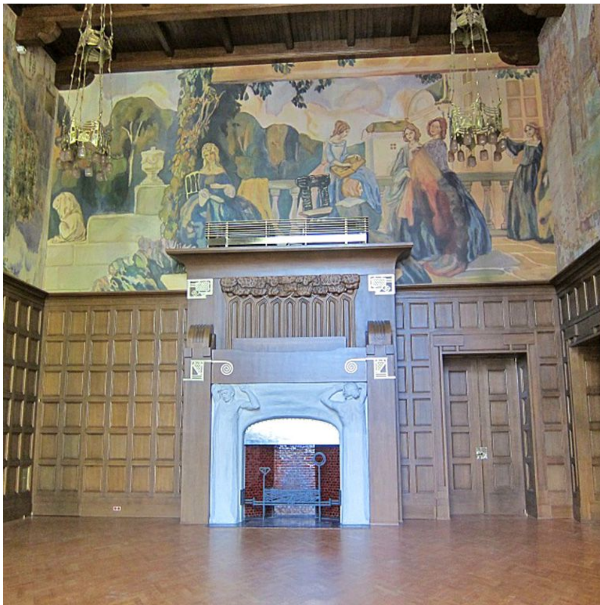
Дом отличался новейшими инженерными технологиями: здесь действовали паровое отопление, вытяжная вентиляция, канализация, водопровод, электричество, телефонная связь. Ф.О. Шехтель не только разработал проект здания, но и продумал концепцию интерьеров особняка: по рисункам самого архитектора была заказана мебель, ткани, светильники, торшеры, двери и наличники, бронзовая арматура. Геометрические орнаменты Шехтель «обыграл» в различных элементах всего дома.

Здание было спроектировано и построено по распоряжению Александры Дерожинской, дочери известного суконного фабриканта Ивана Бутикова, рогожского старообрядца. В качестве архитектора был приглашен знаменитый на всю Москву Ф.О. Шехтель.