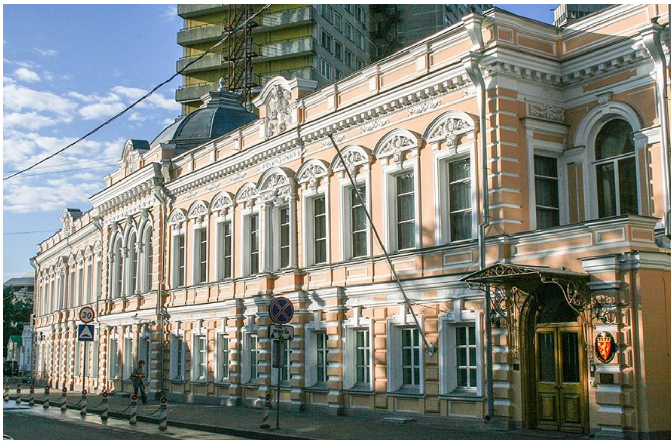
В апреле 1918 года здание пострадало в ходе штурма соседнего дома Цетлиных, в котором находился один из штабов анархистов. В 1921—1925 годах в здании

Усадьба принадлежала Грачевым до 1917 года.