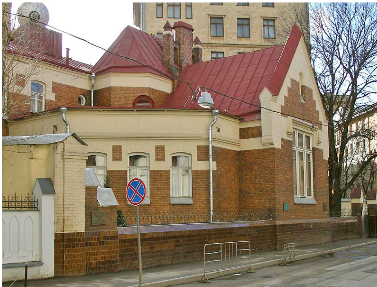
Все помещения выходят в двухсветный лестничный холл, образуя так называемую «круговую» анфиладу. Все помещения здания скомпонованы в разновысотные объемы, живописно и как бы случайно расставленные вокруг лестницы, увенчанной высокой кровлей.

Дом в Ермолаевском переулке — второй его дом из трех сделанных и самый ранний из сохранившихся. Архитектор переезжает в центр и на собственном примере осваивает новейшие принципы современного зодчества.