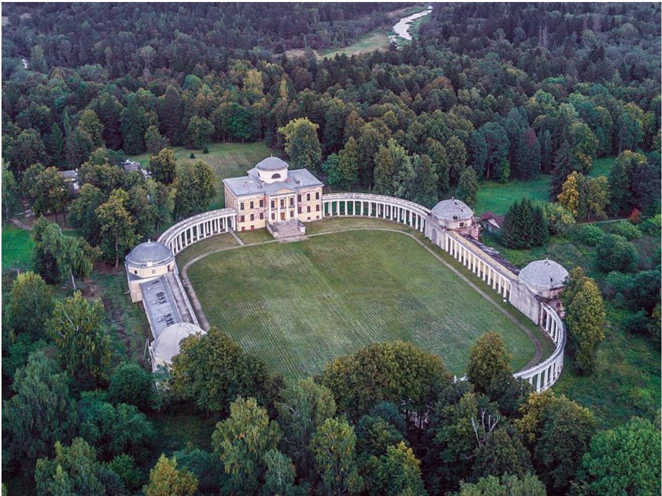
В Брянске волонтеры работали на объекте культурного наследия «Канатная фабрика купца Мартынова». Жители Томска — на территории Гороховских складов. В Тверской области субботник прошел в усадьбе XVIII—XIX вв. Знаменское-Раек — объекте культурного наследия федерального значения, выдающемся памятнике архитектурного наследия, связанного с именем великого русского архитектора Н.А. Львова.

В Санкт-Петербурге участники субботника убрались на Смоленском лютеранском кладбище и на даче Безобразовых «Жерновка». В Крыму работали на воинском кладбище Симферополя и на гражданском кладбище.