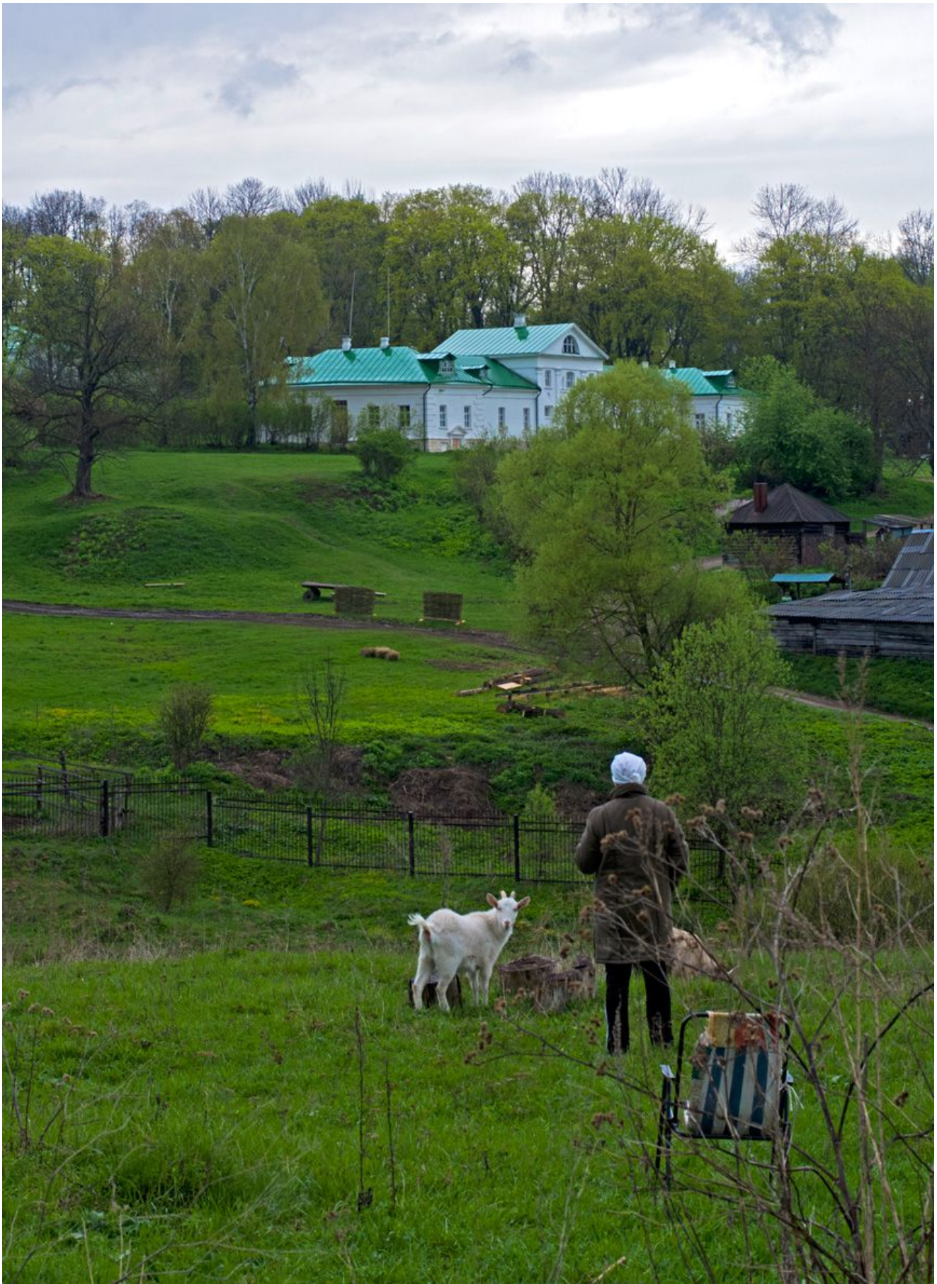
Во время Великой Отечественной войны его экспонаты были эвакуированы в Томск, а сама Ясная Поляна была оккупирована 45 дней. При отступлении немецко-фашистских войск дом Толстого был подожжен, но пожар удалось потушить. К маю 1942 усадьба была вновь открыта для посетителей.