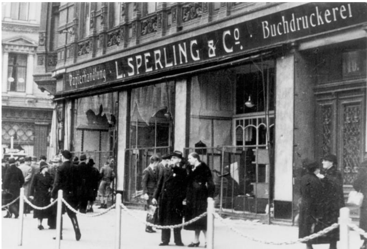
November 1938

В Германии была немедленно организована мощная пропагандистская кампания.