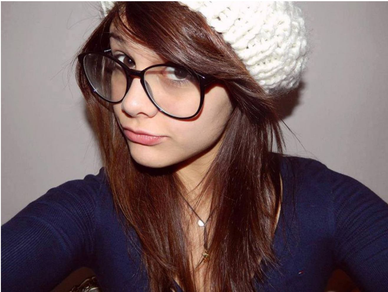
Наконец, в апреле 2019 года пройдет трехдневный конгресс, на котором и состоится официальная презентация Международной наблюдательной службы по кибербуллингу.

Организаторы заявляют, что в работу новой структуры будут вовлечены более 50 высших учебных заведений и представители правительств около 30 стран, ведущие мировые интернет-корпорации, телекоммуникационные агентства, преподавательское сообщество, а также отдельные семьи и учащиеся, которые будут делиться опытом, информацией, методиками и наиболее эффективными практиками в противодействии травле в интернете.