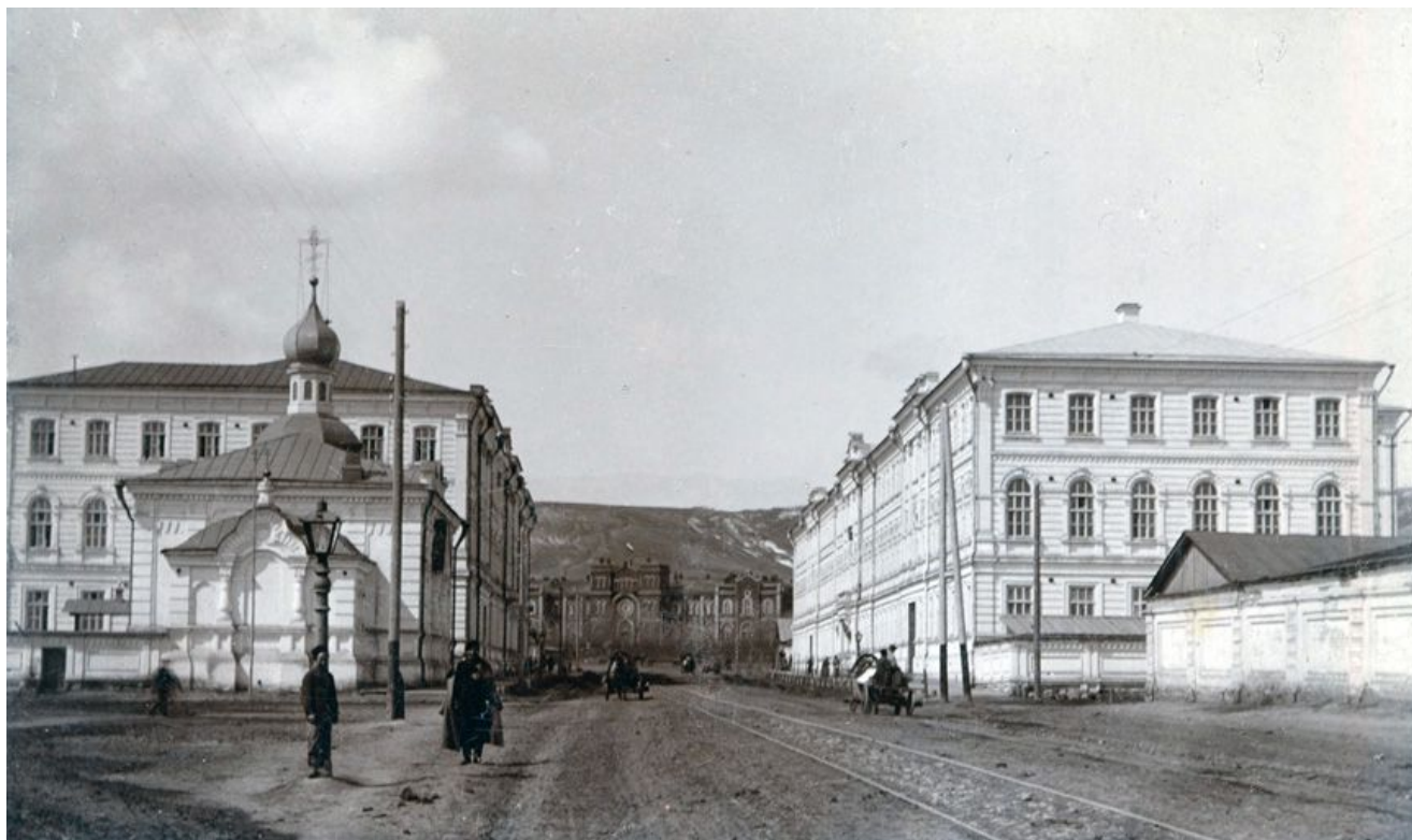
В 1926 году церковь передали под клуб Волжского полка (клуб им. т. Вострецова), купол разобрали. Здание сохранилось до нынешних дней, но в сильно измененном виде. Его занимает предприятие Вычислительной техники и информатики «ВТИ – Сервис». Ведутся переговоры о возможности возвращения здания Саратовской епархии.

Церковь находилась на углу улиц Московской и Губернаторской (ныне — Степана Разина). Храм был построен в 1898 году около казармы Бобруйского батальона. Престол освятили во имя святого благоверного князя Александра Невского.