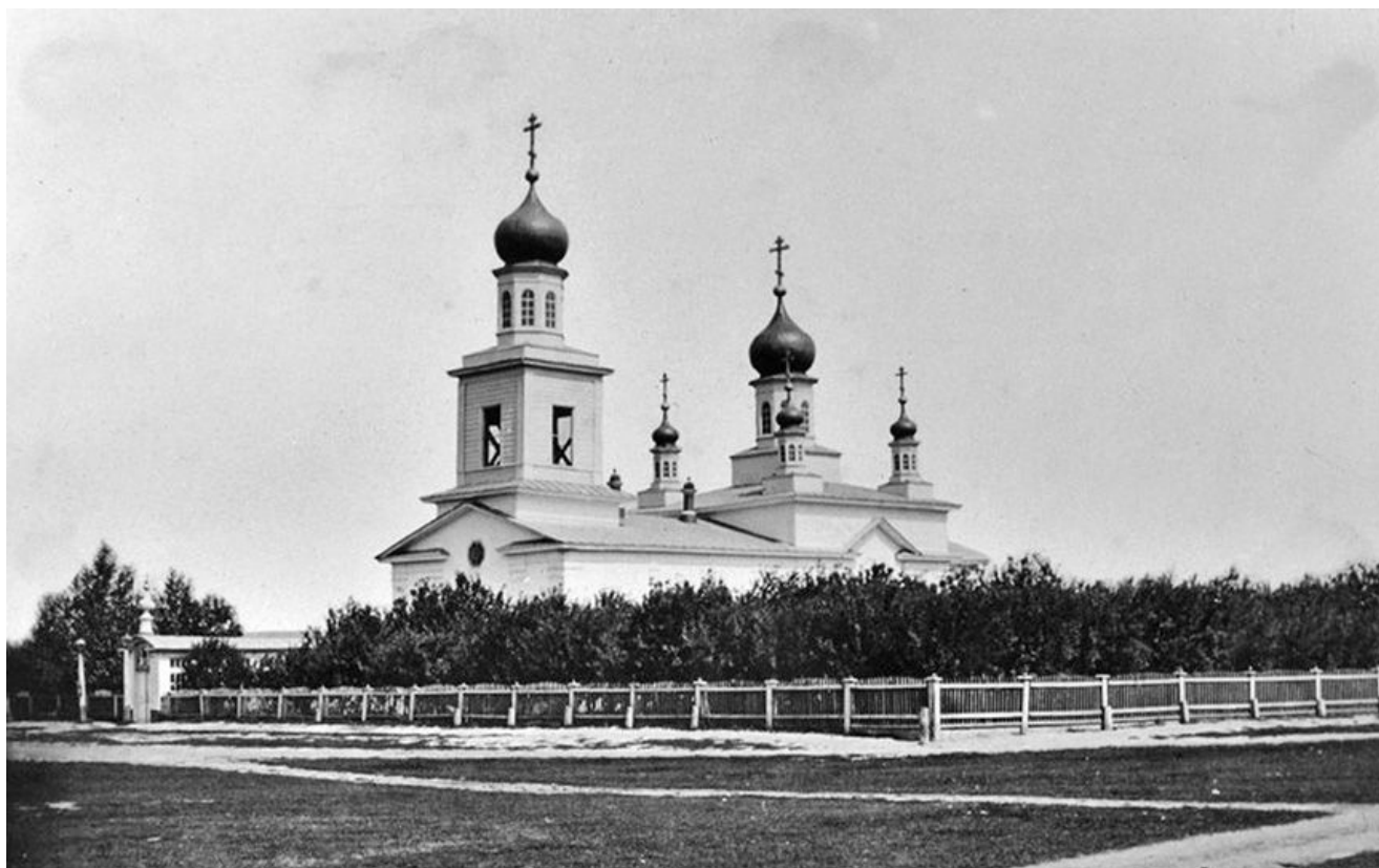
Фото: Карта гонений новомучеников на территории Саратовской митрополии В советские годы храм был закрыт и разрушен. На его месте примерно в 1960-е годы был построен четырехэтажный дом. Сегодня о существовавшей на оживленном перекрестке напротив 9-го корпуса Саратовского университета церкви сохранились лишь архивные записи и старые фотографии. Располагался храм в современном центре города на углу улиц Большой Казачьей и Астраханской.

26 августа 1885 года был освящен придел в честь Казанской иконы Божией Матери. В приходе было более 200 домов, несколько школ, дома для причта (два священника, диакон и два псаломщика) были церковные.