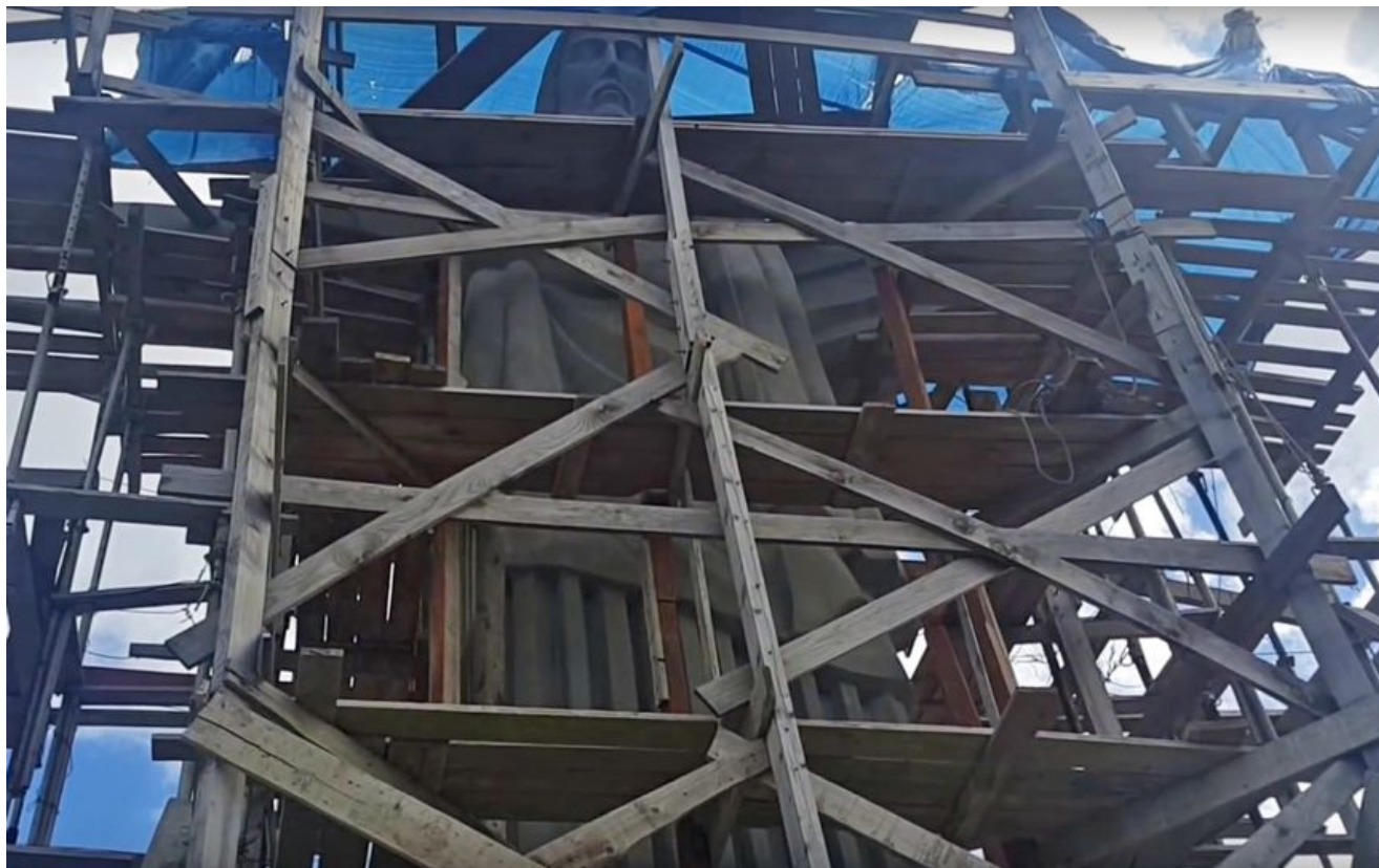
Девятиметровый бетонный Иисус Христос стоит на трехметровом постаменте на Гошевской горе — самой высокой точке города.

«Я думаю, что это будет объединять всех христиан и принесет нам мир», — сказал И. Кисак.