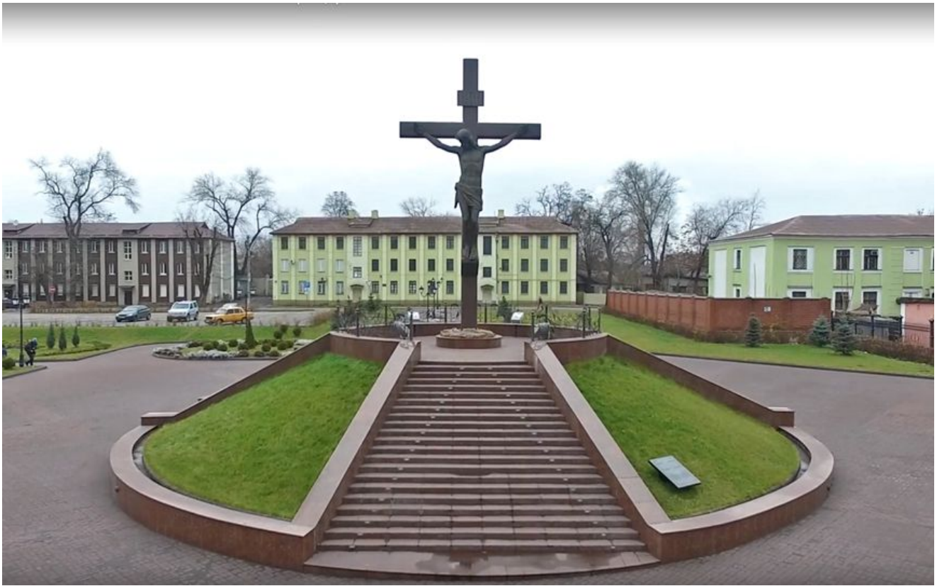
Композиция состоит из холма, который символизирует Голгофу (диаметром 20 тров в основании и высотой 3,3 метра), и креста с распятым Христом Спасителем (высотой девять метров).

Проект и скульптуру создал известный Днепродзержинский скульптор Гарник Хачатрян. Скульптура отлита из бронзы на Южном машиностроительном заводе Днепропетровска. Ее вес составляет восемь тонн.