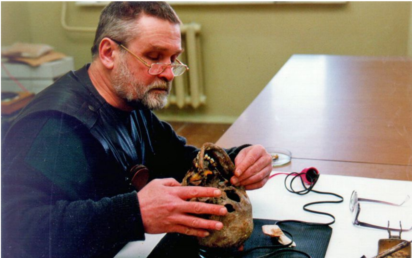
В 2008—2009 годах были проведены исследования обнаруженных в 2007 году останков, обнаруженных летом 2007 года на старой Коптяковской дороге под Екатеринбургом в 70 метрах от основного захоронения и по косвенным признакам предварительно идентифицированных как тела царевича Алексея и великой княжны Марии. Исследования проводились в Лаборатории эволюционной геномики Института общей генетики РАН, Лаборатории по идентификации ДНК Вооруженных сил США (AFDIL) и лаборатории Инсбрукского (Австрия) медицинского института (GMI).

В июле 2015 года распоряжением Правительства РФ была создана межведомственная рабочая группа по вопросам, связанным с исследованием и перезахоронением останков цесаревича Алексея и великой княжны Марии Романовых, которые до сегодняшнего дня хранятся в Государственном архиве Российской Федерации.