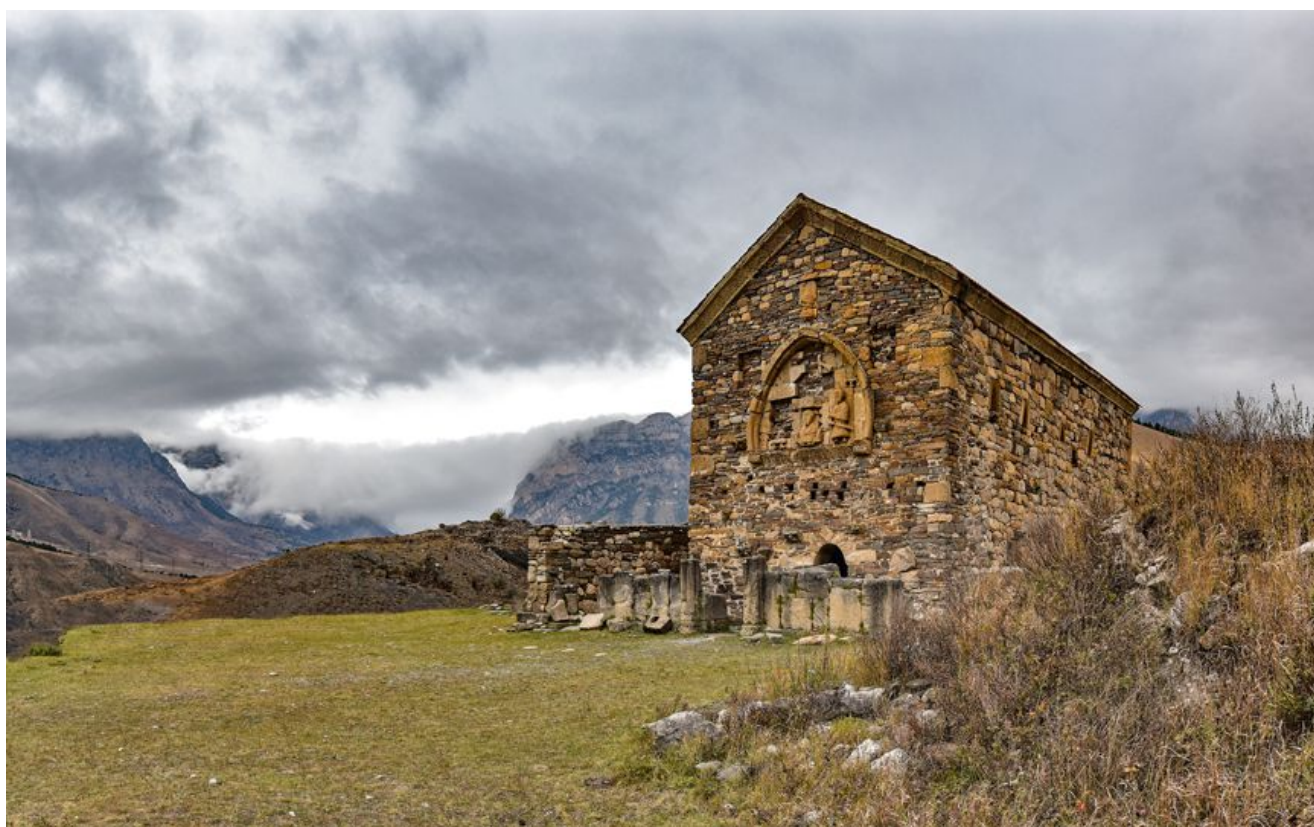
Святилища-здания принято классифицировать на языческие и христианские. Последние идентифицируются как храмы, либо как храмы-святилища, что подчеркивает двойственность их происхождения и культового назначения.

Специальные постройки для культовых целей — святилища-здания и столпообразные святилища — повсеместно возводились исключительно из камня.