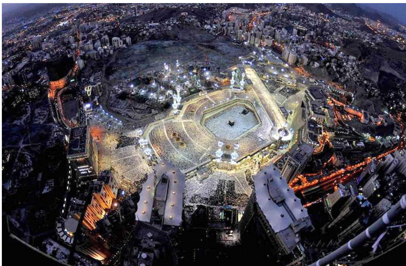
С 2007 по 2012 гг. по решению короля Саудовской Аравии Абдаллы ибн Абдель Азиза Аль-Сауда проводилась новая масштабная реконструкция мечети. В ходе расширения в основном в северном направлении территория увеличилась до 400 тысяч кв. метров

Внутри минаретов была устроена винтовая лестница, ведущая к двум балконам. Минареты венчали массивные полумесяцы, выполненные из позолоченного металла.