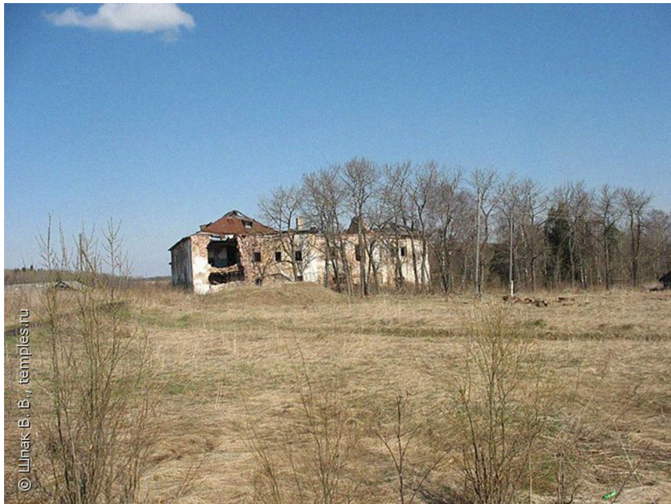
Сотрудники прокуратуры установили, что памятник долгое время пребывает в полном забвении, а какие бы то ни было следы реставрации отсутствуют.

«По итогам осмотра указанного объекта культурного наследия выявлено, что он находится в аварийном состоянии, его существующие повреждения свидетельствуют о непригодности конструкций к эксплуатации, об опасности их обрушения и пребывания людей в зоне расположения конструкций», — констатируется в заявлении.