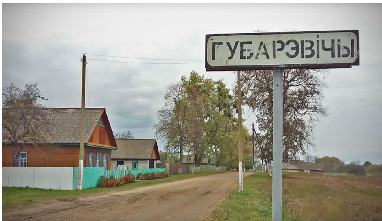
Согласно переписи 1897 года в деревне действовали церковь, школа грамоты, две ветряные мельницы, рядом находился одноименный фольварк.

Согласно письменным источникам известна с XVI века как деревня Губаровичи в Киевском воеводстве. После второго раздела Речи Посполитой (1793 год) была включена в состав Российской империи. В 1811 году стала селом, находящимся во владении помещиков Ракитских. В 1879 году обозначена в числе селений Стреличевского церковного прихода.