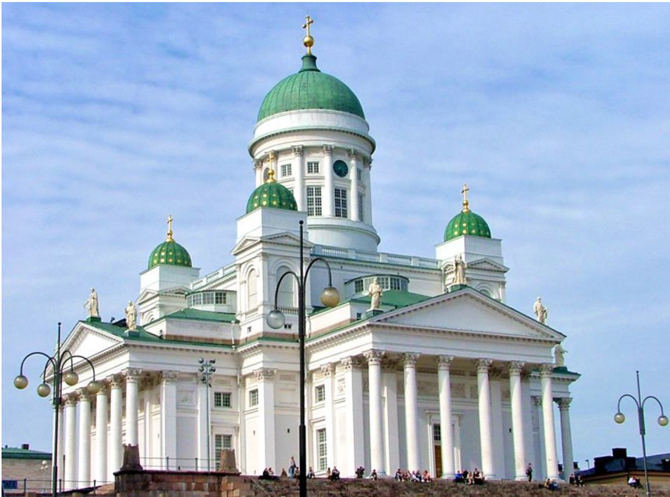
Первоначально Евангелическо-лютеранская церковь Финляндии являлась частью Церкви Швеции, однако была выделена в самостоятельную единицу в 1809 году после присоединения Финляндии к России. В 1812 году в Финляндии было 503 лютеранских прихода.

Апостольская преемственность прервалась в 1889 году, но восстановлена в 1934 году от шведских и англиканских епископов.