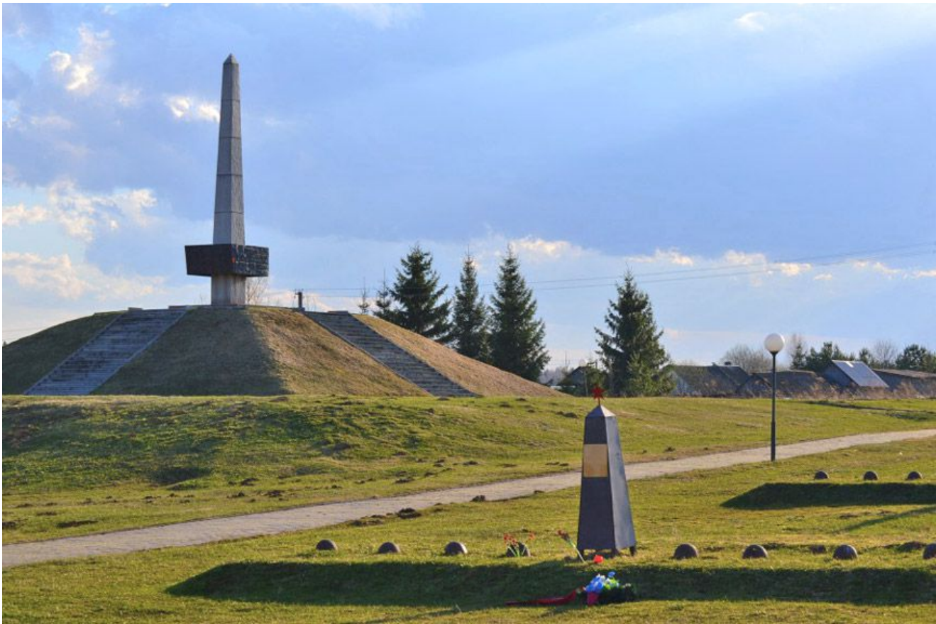
Сразу же после вяземского кошмара войска фашистов вышли на прямое направление к Москве. Но на пути нацистов, как прежде и других захватчиков, снова встало Бородино.

Сюда в середине октября 1941-го перебрасывались силы и средства 32-й Краснознаменной стрелковой дивизии. Участок, который им было поручено прикрывать, растянулся на 45 километров. Фашисты наступали быстрым маршем. У дивизии попросту не было возможности занять плацдарм и укрепиться на нем. Многим подразделениям приходилось выгружаться из эшелонов за тридцать километров от мест боев и совершать пеший марш до своих позиций. По пути следования этим соединениям попадались группы солдат, вырвавшихся из «Вяземского котла», что очень деморализовало бойцов.