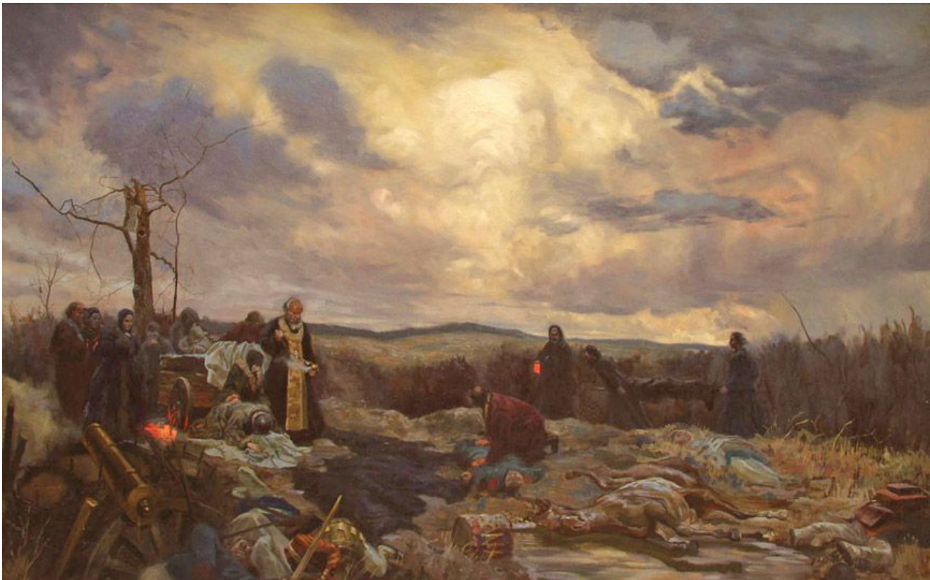
То, что тело возлюбленного, как и тела многих других солдат и офицеров, растворилось в самой Бородинской земле, подтолкнуло Маргариту Михайловну к мысли о святости этих полей. Так она решает возвести здесь храм. Дальнейшую историю вы уже знаете.

Остается добавить, что сын Александра и Маргариты Тучковых дожил до пятнадцатилетнего возраста и скоропостижно умер от простой простуды. Утрата оборвала последние нити, связывавшие эту женщину с миром, и она, сохраняя верность супругу, посвятила свои последние годы служению господу в монашеском чине.