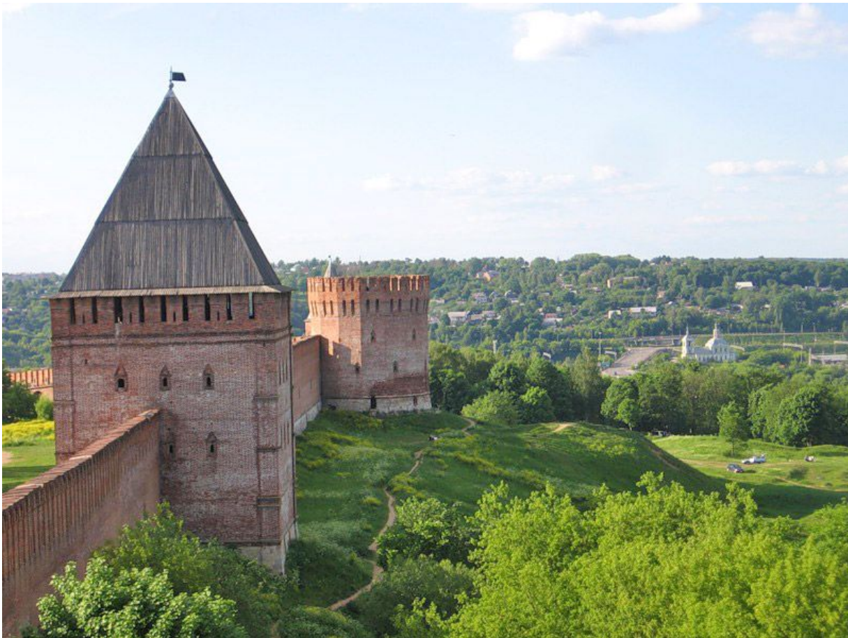
В конце XVIII века император Павел I превращает Вязьму в крупный военный центр, размещая здесь армейские магазины.

Начало XIX столетия ознаменовалось новой бурей. Летом 1812 года по залитым солнцем полям Вязьмы, громяхая амуницией, промаршировала крупнейшая армия мира. В самом городе измученных жарой солдат интересовало лишь одно — колодцы. В считанные минуты они были вычерпаны, из-за подхода к реке тут и там начались потасовки. Сам Наполеон вынужден был вмешаться в одну из них, опрокинув нескольких солдат конем, других наградив ударами хлыста, а одного маркитанта приказав расстрелять.