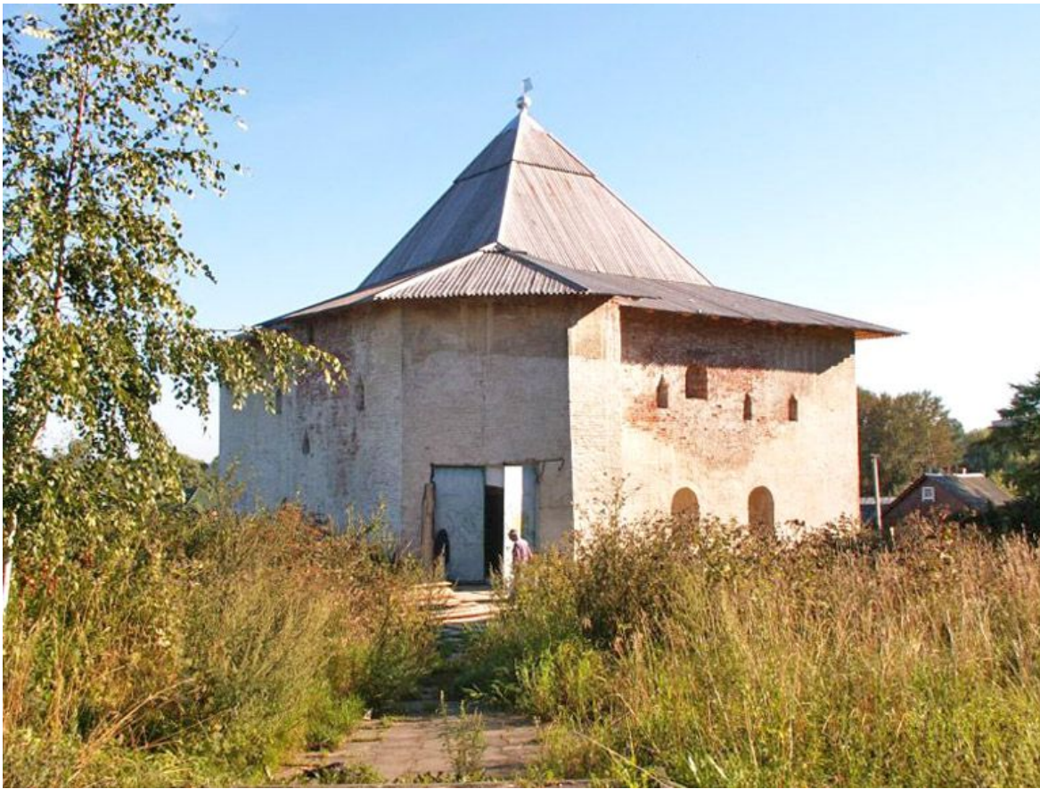
Казалось бы, Вязьме уготована судьба мирного торгового поселения, но именно этому городу впоследствии будет уготована весьма драматическая история.

Московское и Литовское княжества в XIV веке начинают собирать разрозненные татаро-монгольским нашествием и истерзанные в бесконечных усобицах русские земли. А Вязьма как раз лежит посередине между Вильнюсом и Москвой, и, естественно, между обеими державами именно на этом направлении начинается долгое и кровопролитное соперничество.