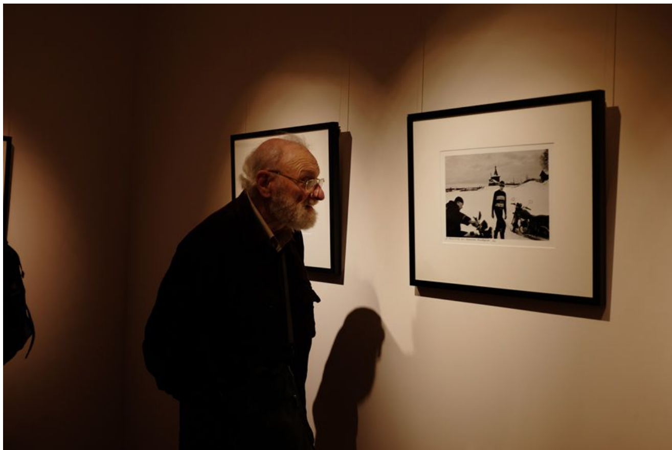
— То есть зритель должен воспринимать каждую работу

— Изначально у меня не было никакой идеи снять проект. Это случайно получилось. Я вообще не ставлю задачи снять проекты, я их не придумываю — они сами по себе как-то вот так складываются... Когда начинаешь придумывать, у меня ничего не получается. А то напридумываешь, едешь потом на съемку и ничего не выходит. Мне проще складывать фотографические истории из какого-то готового материала. Сначала появляется тяга ехать, снимать людей, погружаться в атмосферу, а потом уже что-то делать из этого.